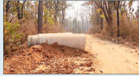
जल्द निर्माण कार्य होगा प्रारंभ

मिली जानकारी के अनुसार नेशनल हाइवे 130 सी मैगपुर देवभाग मुख्यांग दुमरपड़ाव से जांगड़ा तक प्रधानमंत्री ग्राम सड़क योजना के तहत सड़क निर्माण के लिए दिसम्बर 2024 में कार्य प्रारंभ किया गया और